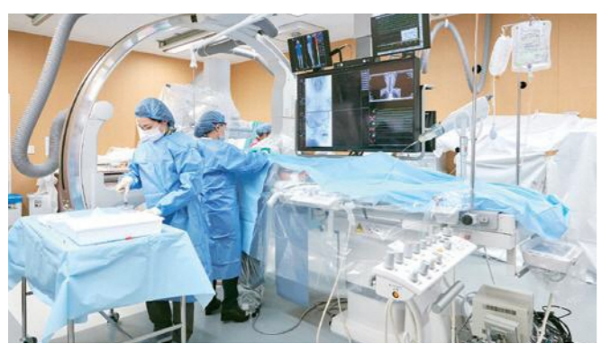
診療棟2F 血管撮影室にて

脳血管内治療とは、頭を切らずにカテーテルという細いチューブを使って、脳の血管の病気を治すという、今や脳卒中治療においては欠かせない治療法です。他院からの患者さんの紹介が多いことが、当科の特徴です。予防治療(未破裂脳動脈瘤など)は、日進月歩で新しい機材が導入されています(その多くは施設限定となっています)が、当科で対応可能です。救急治療(急性期脳梗塞)は、24時間365日対応しており、日本脳卒中学会が認定する一次脳卒中センターのコア施設(横浜市内で5施設)に認定されています。今後も患者さんのニーズに合わせたよりよい治療法を提供いたしますので、いつでもご相談ください。