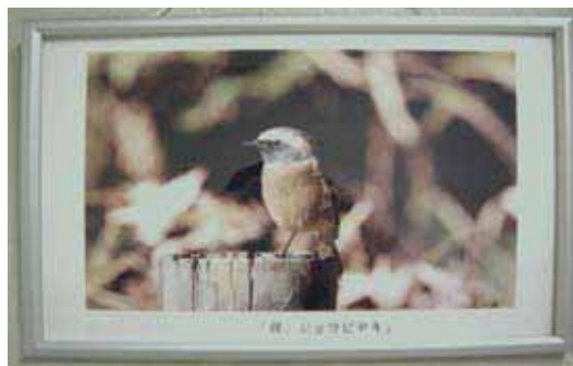
【写真展出典作品の一例】

サービス向上委員会では、病院に勤務するスタッフから、心温まる写真作品を募集し、西病棟地下2階とがん検診センターを結ぶ通路に展示していますので、ぜひご覧ください。今後も患者さんへのサービス向上のため、様々な取組を実施していきます。