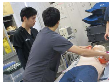
先生からのレクチャー