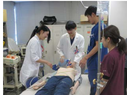
実技中心のコースです