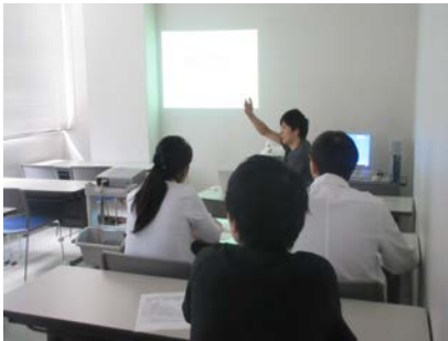
まずはガイダンスからスタート！

当院では月 1 回、初期臨床研修医を対象に「ICLS コース講習会」を開催しています。