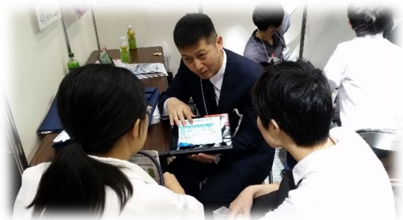
スライドでじっくり説明。質問もなんでも受付！

http://yokohama-shiminhosp.jp/kankei/koki-kenshu/koki-program.html )