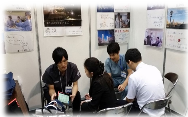
マンツーマンでじっくり説明！

平成 30 年 9 月 17 日（月）、ポートメッセなごやにて開催された「レジナビフェア in 名古屋」に参加しました。当日は 819 名が来場し、その内約 60 名の学生と初期研修医の先生が当院のブースへ足を運んでくれました。お越しいただいた皆様ありがとうございました。