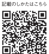
記載のしかたはこちら