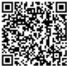
【参考】87・325系統の横浜駅西口・バス停時刻表